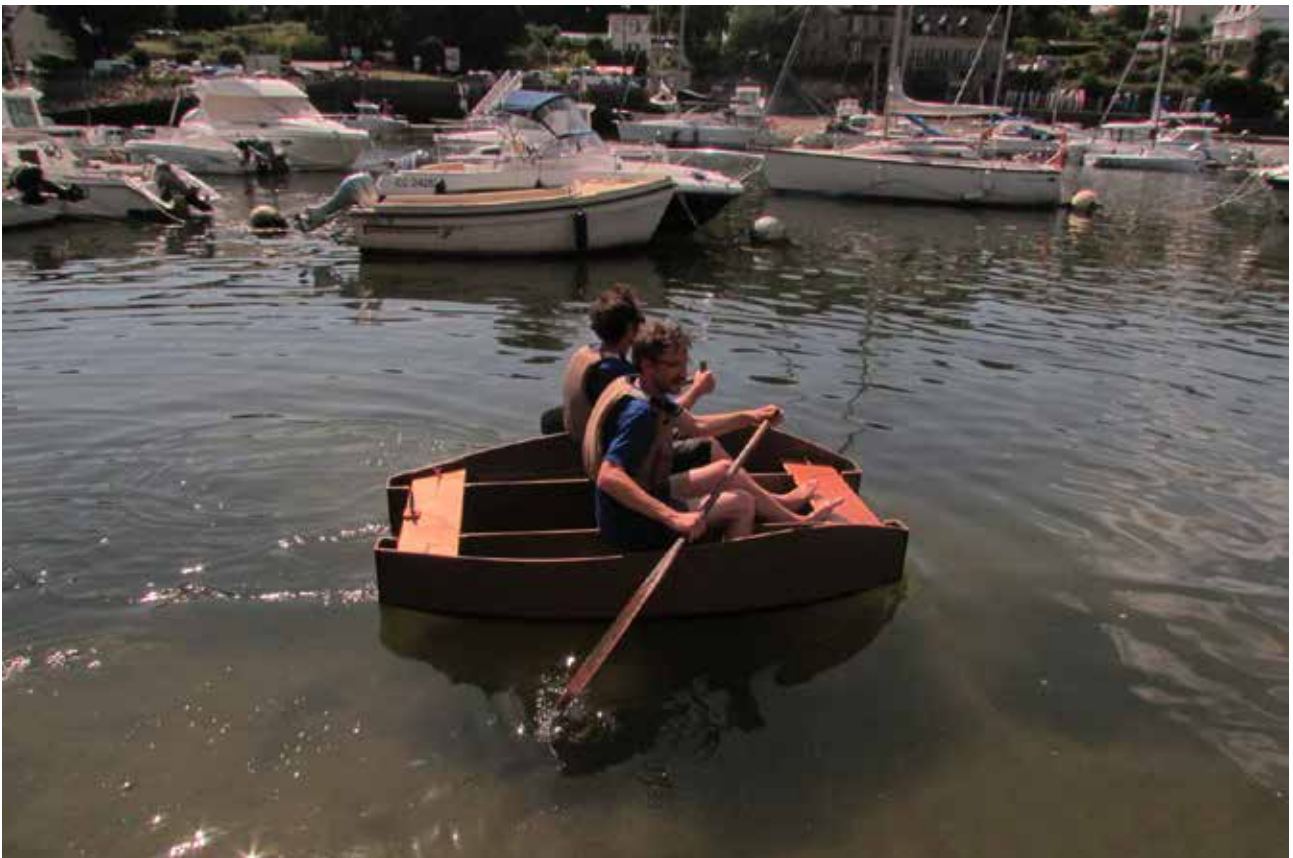
De l'atelier au terrain, de la recherche à l'application - Design de la transition (Projet : "A-VEN", Atelier Z)